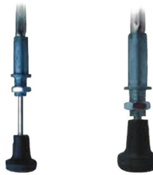
8 手動、電動切換開關