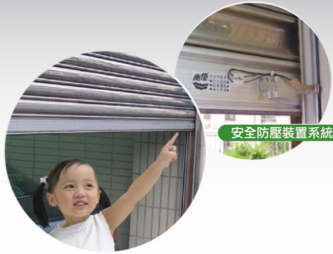
安全防壓裝置系統