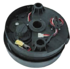
6 DC管內式快速馬達 專利認證M281069號