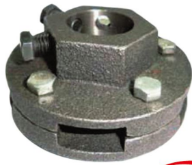
9 彈簧扭力調整器 不需特殊工具，輕鬆調整彈簧