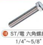
18 ST/電六角螺絲 1/4"~5/8"