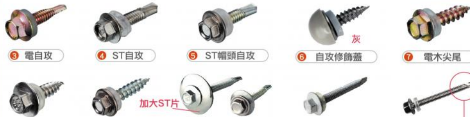
3 電自攻 4 ST自攻 5 ST帽頭自攻 6 自攻修飾蓋 7 電木尖尾 8 ST尖尾 9 ST帽頭尖尾 10 ST帽頭+ST片 11 410白鐵+機械鍍鋅 12 自攻釘+削口